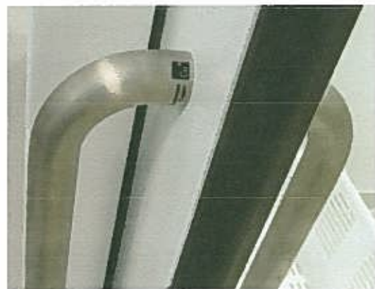
Cu+ドアハンドル【ユニオン製 使用素材...クレンジングライト(三菱伸銅)】