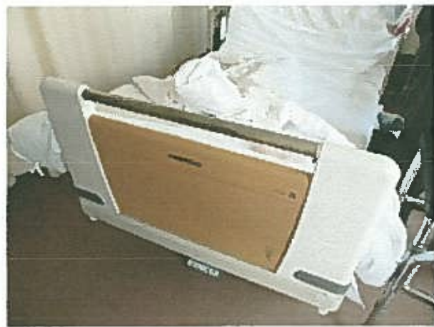
Cu+ベッド (フランスベッド製 クリーンライト製ヘッド・柵、オーバーテーブル、ヘッド・フットレール)