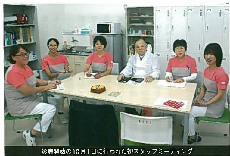
診療開始の10月1日に行われた初スタッフミーティング

診療初日に来院した白血病の患者 この人を見つけただけでも 診療所を開設した価値があった